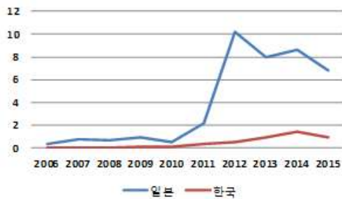
그림2. 일본과 한국의 대 미얀마 차량 및 그 부속품 수출 6) (단위: 억 달러)