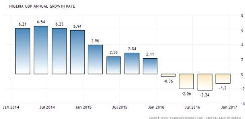
그림 1.나이지리아 GDP 연평균 성장률

□ 그러나 몇몇 분석가들은 이에 대해 의문을 표시하면서, 나이지리아의 경기 침체는 나이지리아의 경제 구조로 인한 현상일 뿐, 국가가 적절한 정책을 고안하는 능력이 없어서가 아니라고 주장함.